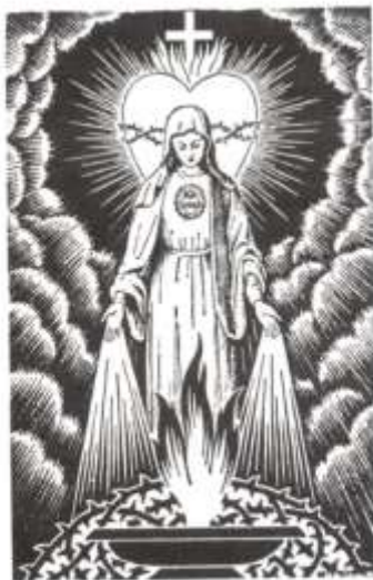
«Je veux que La Flamme d'Amour de mon Cœur Immaculé soit connue partout, tout comme mon Nom est connu partout dans le monde.» (Paroles de la Vierge Marie à l'âme privilégiée)

Je vous ai procuré cette grâce du Père Éternel par les mérites des cinq Plaies de mon Divin Fils.»