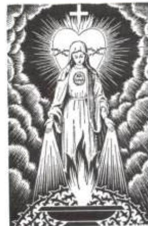
«Je veux que La Flamme d'Amour de mon Cœur Immaculé soit connue partout, tout comme mon Nom est connu partout dans le monde.» (Paroles de la Vierge Marie à l'âme privilégiée)

Alors la Mère de Dieu a tant sangloté que je n'ai pas compris ce que je devais faire. Au nom de tous, j'ai tout promis pour alléger ainsi sa douleur, car mon propre cœur fut presque sur le point d'éclater.